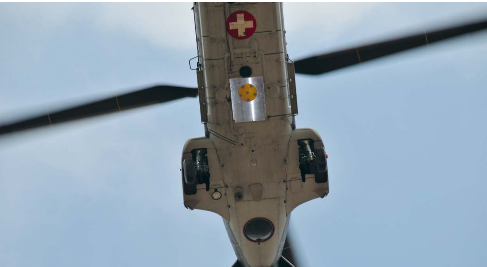
Der Technologiedemonstrator war an der Unterseite des Helikopters angebracht.