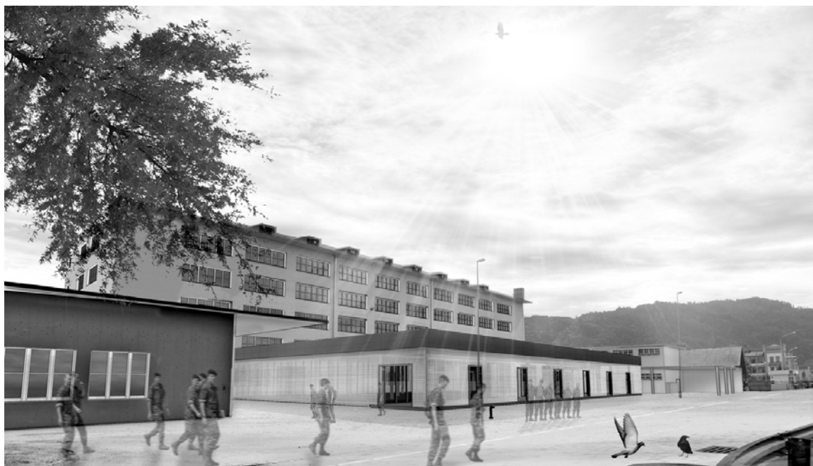
Caserma Dufour con annesso nuovo centro di sussistenza (visualizzazione)