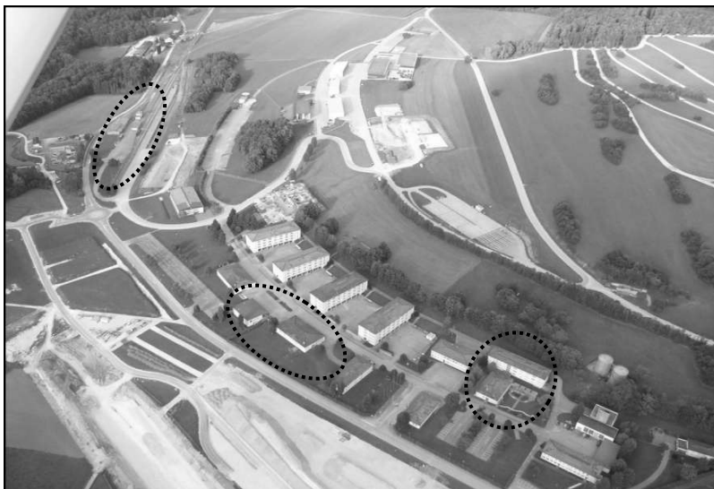
Veduta aerea della piazza d'armi di Bure con le misure della 2 a tappa