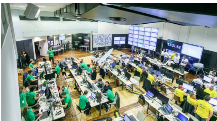
Kontrollraum der Cyber Defence Übung Locked Shields.

Das Blue Team der Schweiz setzt während Locked Shields 2019 ein neuartiges Verfahren vom CYD Campus ein.