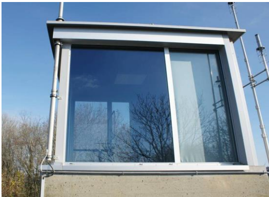
Gebäude PC, Schiessplatz Forel