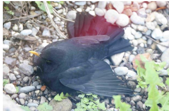
Verendende Amse nach Kollision mit Glasscheibe

Vögel können Hindernisse in ihren Lebensräumen leicht umfliegen aber auf unsichtbare Hindernisse wie Glasscheiben sind sie nicht vorbereitet. Kollisionen sind darum häufig. Die Schweizerische Vogelwarte Sempach schätzt, dass allein in der Schweiz jährlich Hunderttausende von Vögeln auf diese Weise umkommen. Betroffen sind fast alle Vogelgruppen, darunter auch seltene und bedrohte Arten.