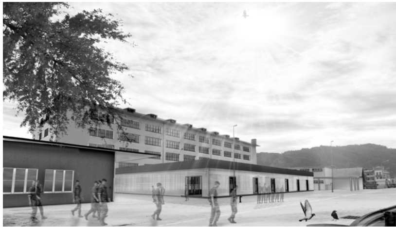
Dufourkaserne mit neuem Anbau des Verpflegungszentrums (Visualisierung)